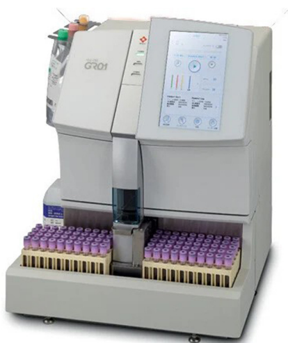
FIGURE 5 Automate GR01, société TOSOH

services comme les urgences ou les ambulances. Ils proposent également un nouveau logiciel : QuidelOrtho Results Manager System pour le management des résultats en chimie et immuno-analyse.